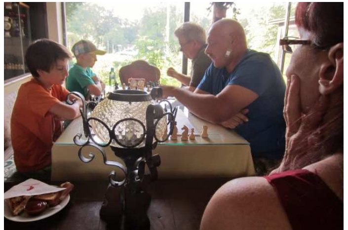
Der Cobenzl ist ein Ort der Begegnung auch abseits der 64 Felder. „Freude durch Schach“ kommt vor „Erfolg im Schach“.